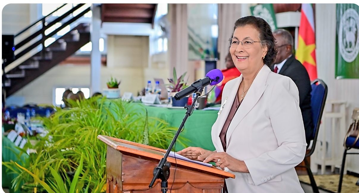
President van de Republiek Suriname, mevrouw Jennifer Geerlings-Simons spreekt 20ste Synode EBGs toe.

Het bestuur van Stichting FAMM was voor deze synode als toehoorder uitgenodigd en kreeg de gelegenheid een presentatie te doen over haar ontstaansgeschiedenis, regels, werkwijze en toekomstperspectieven. De Synodalen maakten van de gelegenheid gebruik om vragen te stellen aan de bestuursleden.