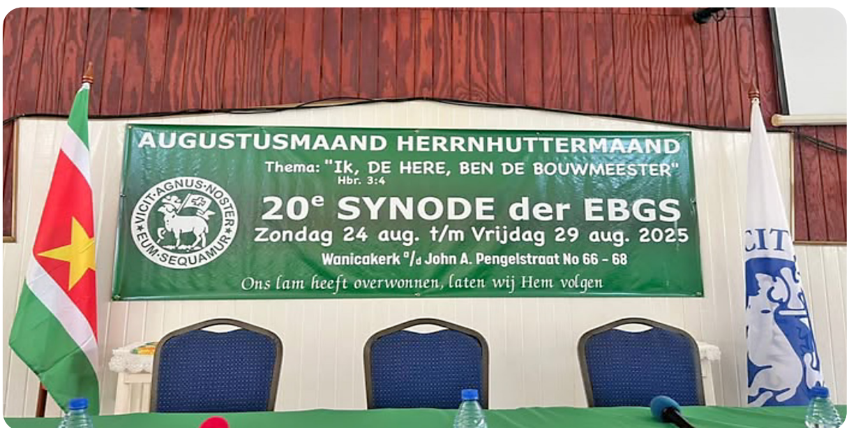
EBGS Augustusmaand

De synode van de EBGs, die in 2025 voor de twintigste keer plaatsvond, is een grote kerkvergadering en wordt om de vijf jaar gehouden met afgevaardigden van alle structuren van de EBGs om terug te kijken en vooruit te kijken. Van 24 tot en met 29 augustus kwam men bijeen in de Wanicakerk.